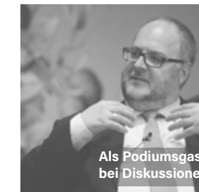
Als Podiumsgast bei Diskussionen

Und deshalb muss man zum anderen die Bedeutung von Sachwerten erkennen!