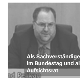
Als Sachverständiger im Bundestag und als Aufsichtsrat