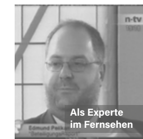
Als Experte im Fernsehen